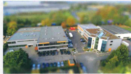
Luftaufnahmen MUNK GmbH

Das wissen übrigens auch unsere Kunden: Neben der erstklassigen Qualität und Beständigkeit unserer Produkte schätzen sie vor allem das „Drumherum“. Bevor wir einem (Neu-)Kunden unsere Produkte präsentieren, erkundigen wir uns erst einmal nach seinen Bedürfnissen und Anforderungen und gehen mit ihm in den Dialog, um letztlich gemeinsam die optimale, maßgeschneiderte Lösung zu erarbeiten – getreu dem Motto „Taylormade in Germany“. Natürlich geht es auch „von der Stange“, sofern es für den Kunden passt. Unser breites Produktportfolio bietet hier unzählige Möglichkeiten. Ein weiteres Argument für die MUNK GmbH ist die hohe Flexibilität und Nähe zum Kunden, sei es in puncto Beratung, Umsetzung oder Wartung/Kalibrierung.